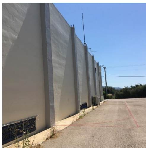
Ακάλυπτος χώρος (15/06/2018)