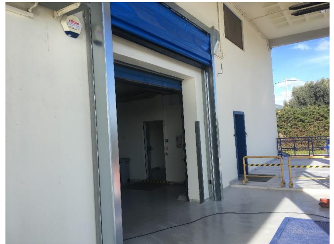
Εξωτερική όψη του ακινήτου (28/11/2018)