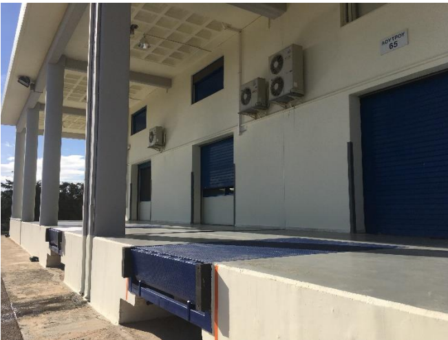
Εξωτερική όψη του ακινήτου (28/11/2018)