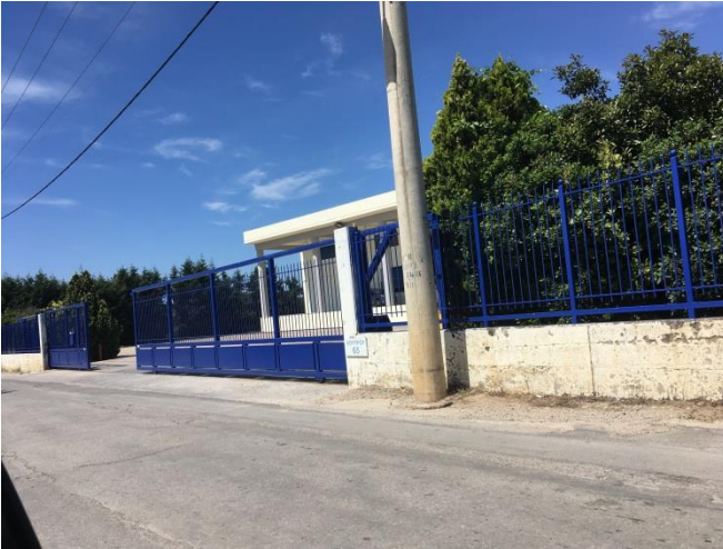
Όψη του ακινήτου από την οδό Λουτρού (15/06/2018)