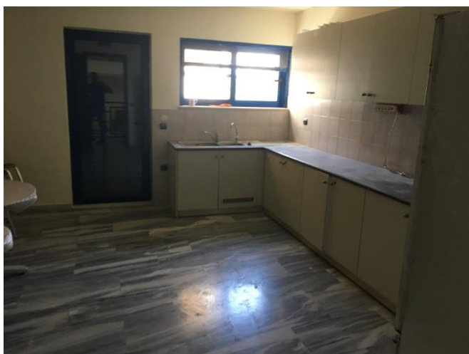
1ος όροφος (15/6/2018)