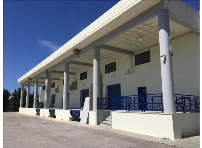
Εξωτερική όψη του ακινήτου (15/06/2018)