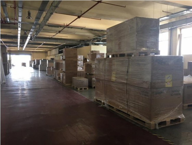
Εσωτερική όψη αποθηκευτικού χώρου