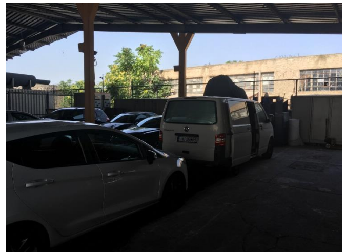
Εξωτερική όψη θέσεων στάθμευσης