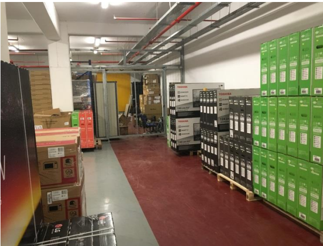
Εσωτερική όψη αποθηκευτικού χώρου