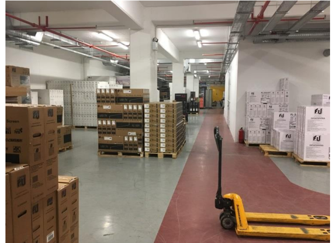
Εσωτερική όψη αποθηκευτικού χώρου