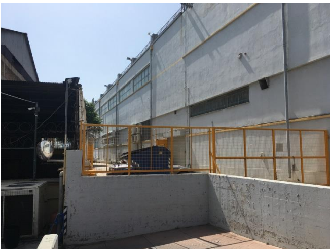
Εξωτερική όψη ακινήτου