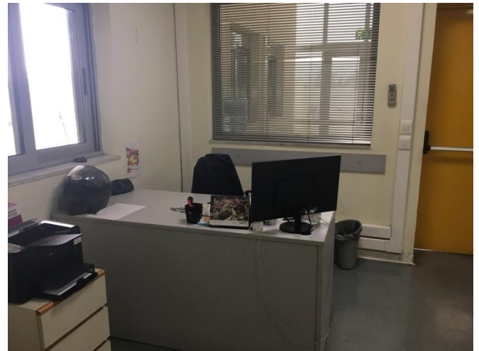
Εσωτερική όψη γραφειακού χώρου